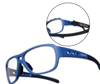
447180-2 || X-Fusion Blau (S) 447181-2 || X-Fusion Blau (M) 447182-2 || X-Fusion Blau (L)

Mit Hochsicherheitskunststoff TR90 / TPR