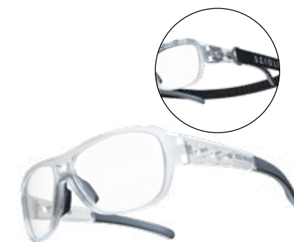
447180-1 || X-Fusion Cristall Matt (S) 447181-1 || X-Fusion Cristall Matt (M) 447182-1 || X-Fusion Cristall Matt (L)