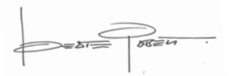
CEO Optic Fashion GmbH