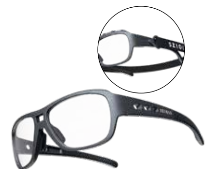
447180 || X-Fusion Schwarz Matt (S) 447181 || X-Fusion Schwarz Matt (M) 447182 || X-Fusion Schwarz Matt (L)